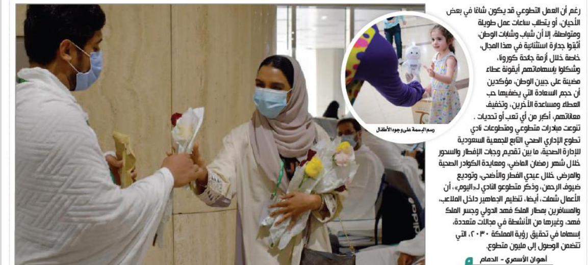
رسم البسة على وجوه الأطفال

رغم أن العمل التطوعي قد يكون شاقاً في بعض الأحيان، أو يتطلب ساعات عمل طويلة ومتواصلة، إلا أن شباب وشابات الوطن، أتوا جذرة استثنائية في هذا المجال، خاصة خلال أزمة جحة كورونا، وشكلوا يساهماتهم أيقونة عطاء مضية على جبين الوطن، مؤكداً أن حجم المساعدة التي يضيفها حب العطاء ومساعدة الآخرين، وتخفيف معاناتهم، أكبر من أي تعب أو تحديات. تتوعت مبادرات تطوعي ومطوعات تاتي تطوع الإداري الصحي التابع للجمعية السعودية للإدارة الصحية، ما بين تقديم وجبات الإفطار والسور خلال شهر رمضان الماضي، ومعايدة الكوادر الصحية والمرضى خلال عيادي الفطر والأضحى، وتوزيع طيوف الرحمن، وذكر متطوعي النادي «اليوم»، أن الأعمال شملت، أيضا، تنظيم الجماهير داخل الملاعب، والمسافرين بطار الملك فهد الدولي وجيبو الملك فهد، وغيرها من الأنشطة في مجالات متعددة، يساهم في تحقيق رؤية المملكة 2030، التي تتضمن الوصول إلى مليون متطوع.