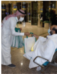
مساعدة وفود الحج والعمرة